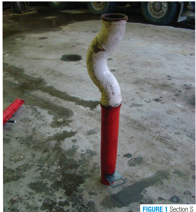
FIGURE 1 Section S

Le CCDG du MTQ exige que les entrepreneurs utilisent à la fin de la conduite de la pompe, une section réductrice d'au moins 20% suivie d'une section en « S » formée de 2 coudes à 45 d'au moins 275 mm de longueur chacun et d'un dispositif de fermeture (figure 1).