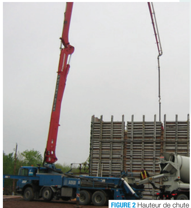
FIGURE 2 Hauteur de chute

Le mécanisme de dissolution est explicable avec les efforts de friction du béton avec les parois de la ligne de pompage en fonction de la pression appliquée sur le béton. L'augmentation de la pression appliquée sur le béton, souvent occasionnée par un manque de pâte le long des parois, provoque une dissolution progressive des petites bulles d'air et donc une réduction du nombre total de bulles contenues dans le béton.