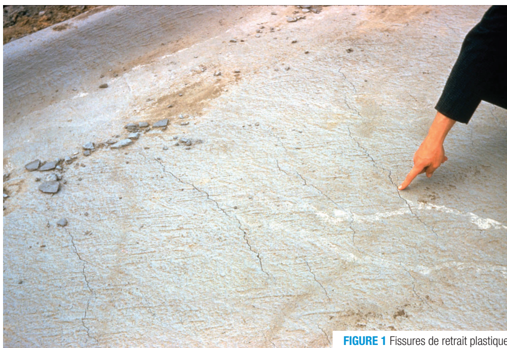
FIGURE 1 Fissures de retrait plastique

Note : il existe des fissures de retrait qui se produisent à l'état plastique et qui sont reliées au tassement du béton.