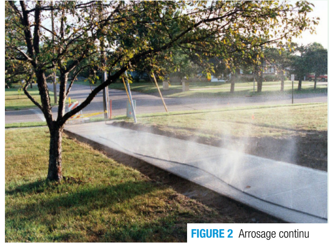
FIGURE 2 Arrosage continu

Une pellicule de polyéthylène recouvrant la toile diminue le nombre d'arrosages et peut être utilisée lorsqu'un arrosage soutenu est optionnel pour refroidir le béton.