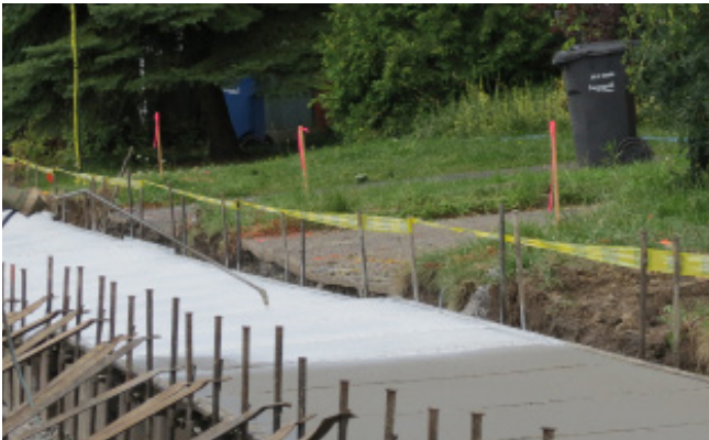
FIGURE 1 Vaporisation d'un produit de cure formant membrane

Les produits de cure formant une membrane sont composés de cire, de résines, de caoutchouc chloré et de solvants très volatils et servent à réduire ou à retarder l'évaporation de l'eau du béton. Ils doivent être appliqués rapidement sur le béton frais ou sur les surfaces de béton après le décoffrage. De plus, ces produits doivent être vaporisés manuellement ou mécaniquement, en respectant le taux d'application recommandé par le fabricant, et être appliqués au moment opportun (figure 1). Leur utilisation est à éviter pendant la période de ressuage du béton.