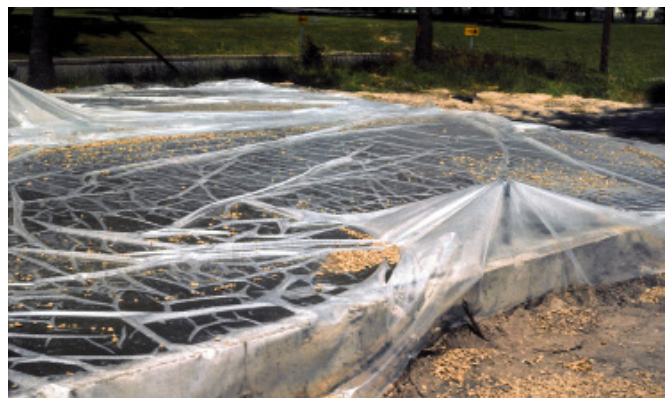
FIGURE 3 Utilisation d'une pellicule de polyéthylène

L'utilisation de pellicules de plastique ou de papiers imperméables peut s'avérer suffisante sur des surfaces horizontales ou sur des bétons structuraux ayant des formes simples (figure 3). Ces méthodes diminuent le besoin d'apport d'eau continu et assurent une hydratation adéquate du ciment en empêchant l'eau de s'évaporer. Elles sont à éviter lorsque les surfaces apparentes du béton sont importantes, ainsi que par temps chaud à cause de l'effet de serre. Si le papier imperméable est abîmé pendant la période de protection, il faut réparer et sceller la partie endommagée.